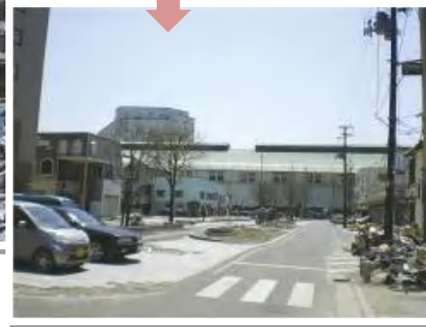
2011.5 災害廃棄物撤去後 (岩手県釜石市大町付近)