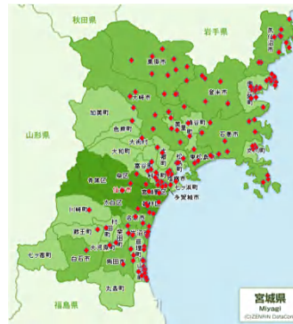
(県内の仮置場設置状況)

➢5/31現在、沿岸市町村の仮置場への搬入済量は、合計で約980万t。災害廃棄物推計量約1,154万tの約85%。