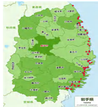
(県内の仮置場設置状況)

➢ 処理・処分量は約64万tであり、災害廃棄物推計量に対し約 12.1% ➢ スケジュール： 平成26年3月末までに処理を完了