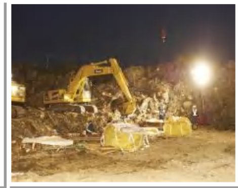
2011.12 夜間作業の様子 (宮城県石巻市)