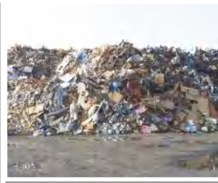
2011.11 仮置場の様子 (岩手県宮古市)