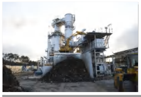
仮設焼却炉(仙台市)