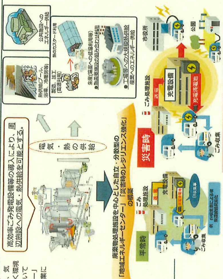
廃棄物発電電力を災害時の非常用電源として有効活用

お問合せ先： 環境省 環境再生・資源循環局 廃棄物適正処理推進課 電話：03-5521-9273