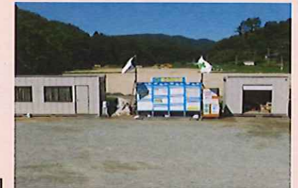
川俣町山木屋地区における仮置場整備状況(平成26年7月)