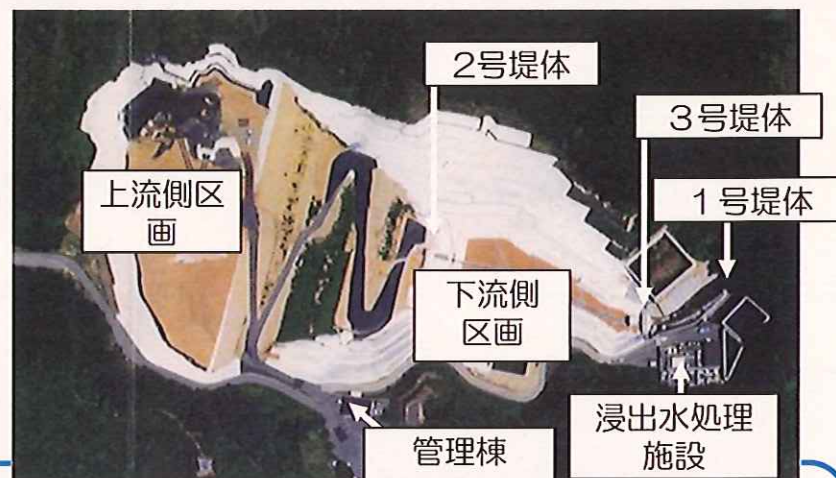
フクシマエコテッククリーンセンター