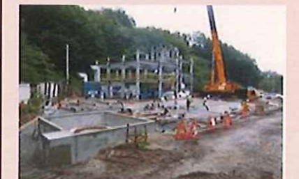
川内村における仮設焼却施設の建設状況(平成26年8月)