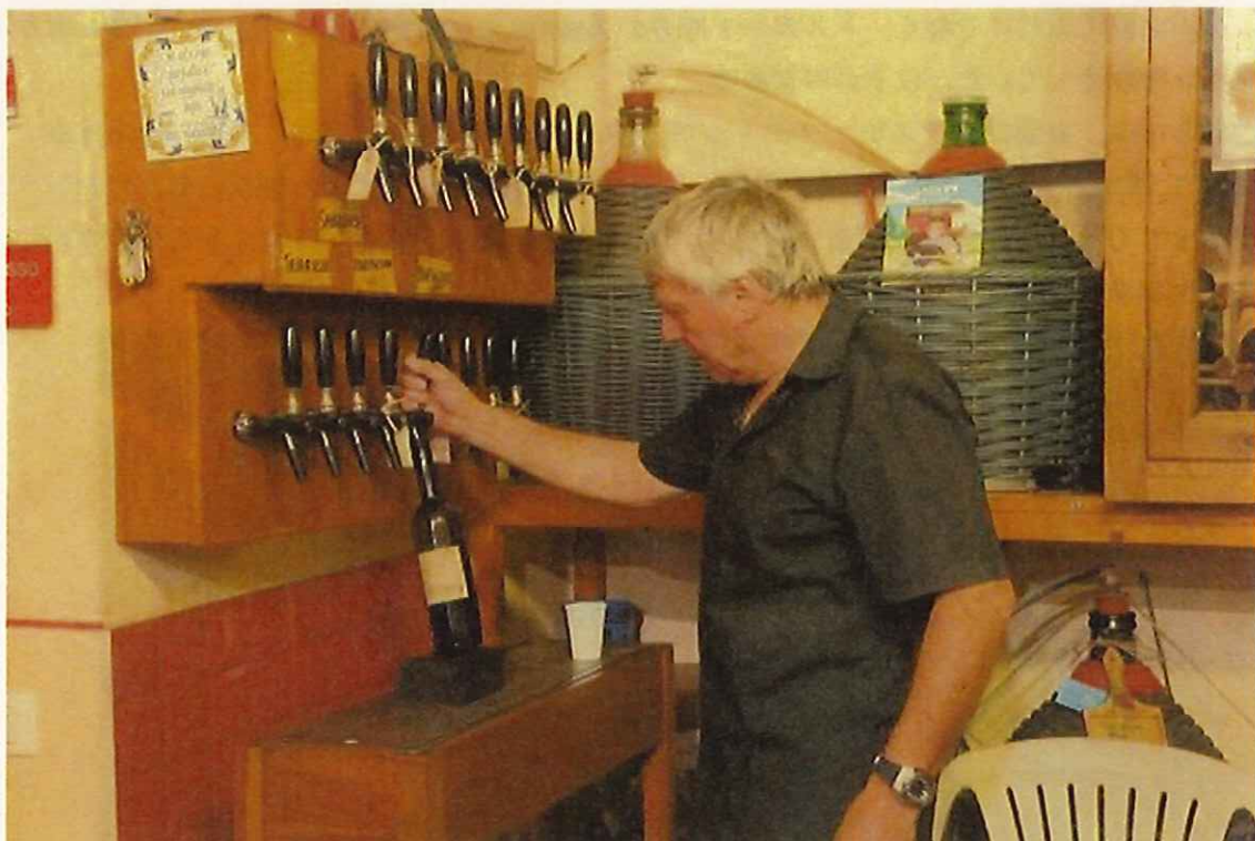
赤、白ともかなりの種類からその日の気分、財布の状態から選べる。