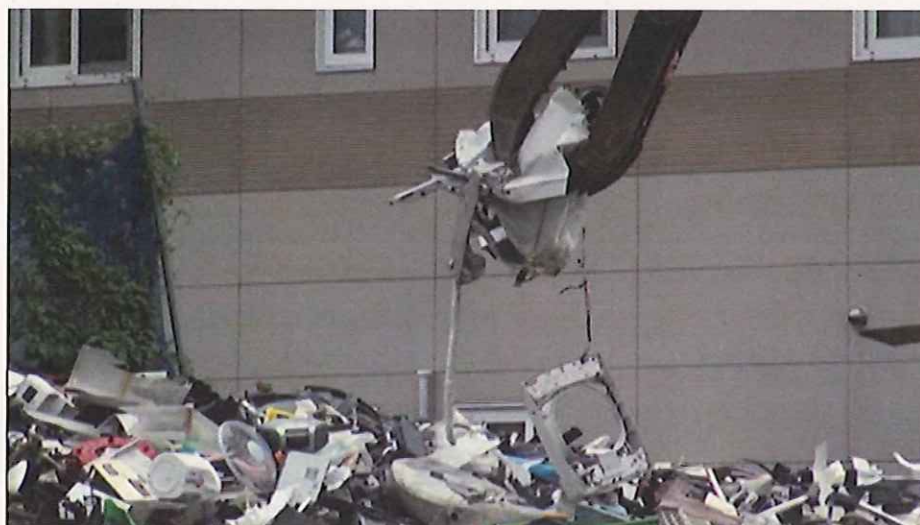
【写真 3-1 洗濯機の破碎状況（平成 24 年 9 月 9 日撮影）】

上記①から⑤までの営業実態を踏まえ、他の業者と同様に「改善指導書」を交付（3回）し何度も指導するが、家電製品等の破碎（写真 3-1）を繰り返す。